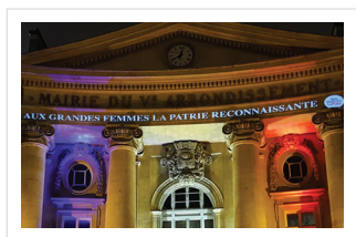
Le 08 mars 2017 À LA MAIRIE DU 5 e